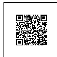
Zažádejte o vytyčení

Přílohy: Orientační zakres plynárenského zařízení, Detailní zakres plynárenského zařízení, Ověřená příloha žadatele